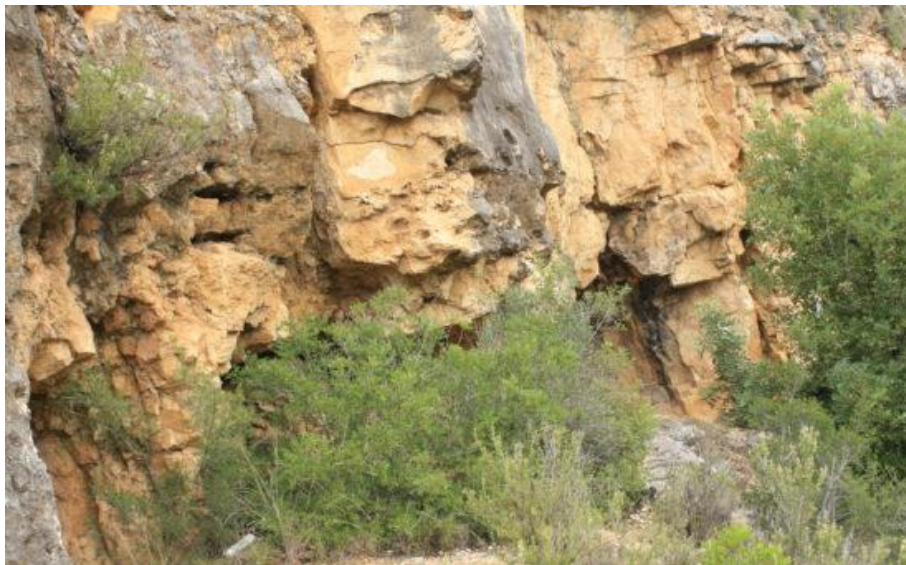
Vista de las Cuevas de la Pedrera desde el barranco.

Nota importante: Queda totalmente prohibido realizar acampada, fuego o cualquier práctica que dañe el medio ambiente incluyendo las figuras patrimoniales. Se le recuerda que se encuentra dentro del PN del Turia, amparado por leyes de conservación mediambiental y figuras de protección.